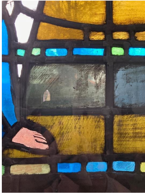
Detaljer fra venstre korvindue forneden, Maria Bebudelse.