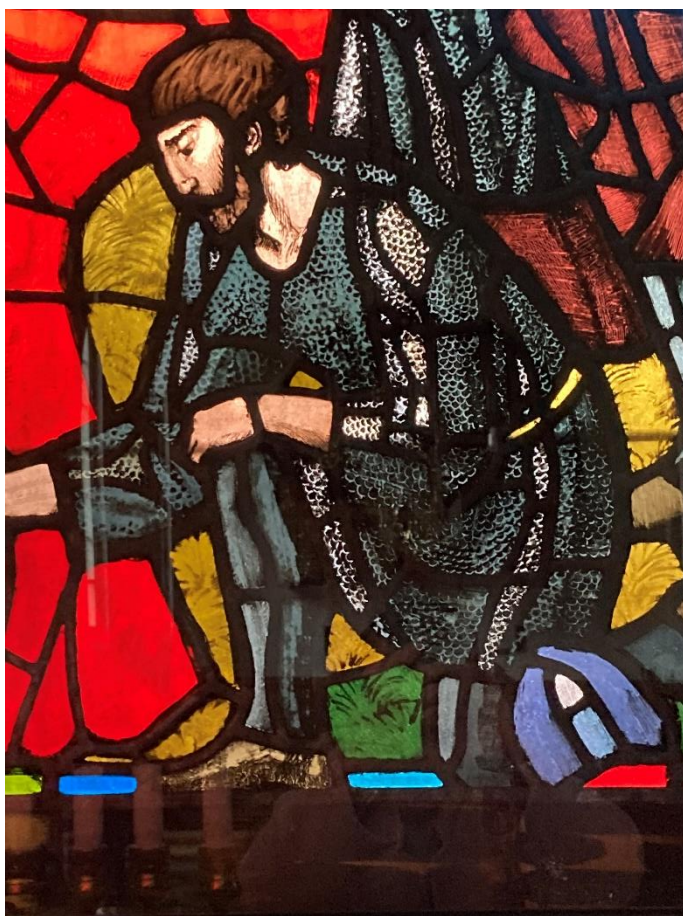
Fra lodtrækningen om kappen i det midterste korvindue forneden. Bemærk mønstret i hans beklædning.

Og et godt stykke håndværk blev det, som det kan ses af nedenstående.