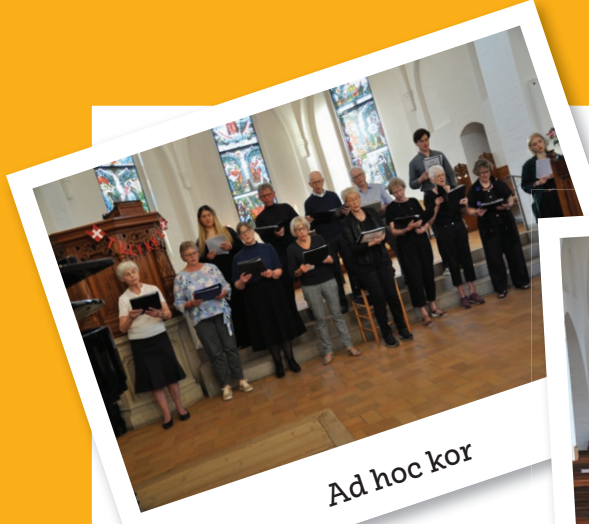
Ad hoc kor