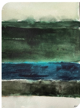
Akvarel af Anne-Lise Østrup.

Antallet af deltagere varierer fra gang til gang. Vi har både været 7 og 23. Studiegruppen er åben for en vis trafik, og det er muligt