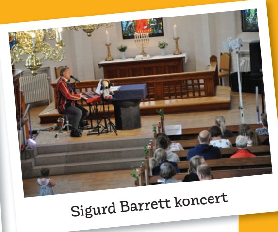
Sigurd Barrett koncert