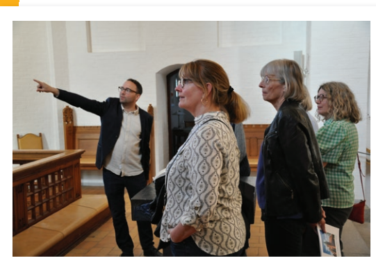
"Kend din kirke"