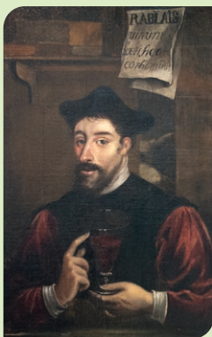
"François Rabelais au verre". Oliemaleri fra 1700-tallet af anonym maler. Billedet findes i dag på Musée Rabelais.

Foredraget vil også handle om Rabelais' brug af bibelen, om latteren og det hellige og hvordan dette forhold kan vendes og drejes. Den franske mester forstod parodiens svære balancegang mellem alvor, respekt, fjogede smil og agtelse for den faste, som han forstod at omsætte til livsfest. ■